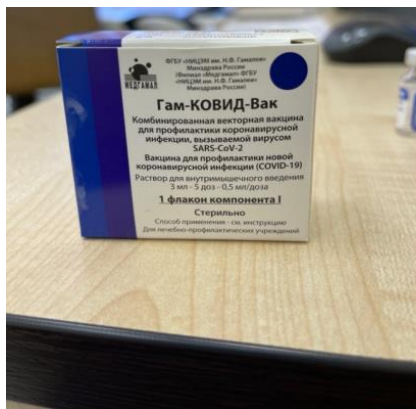
Component I (secondary packaging)

Paper box containing 5-dose vial for 3 ml