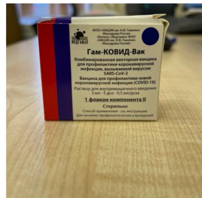
Component II (secondary packaging)

Paper box containing 5-dose vial for 3 ml